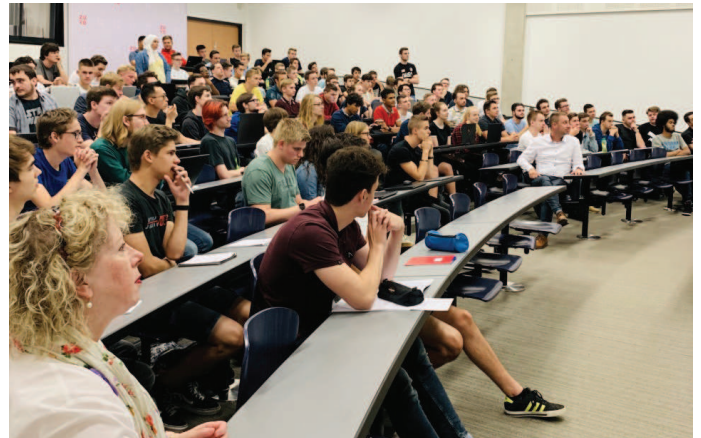
Onlangs is ook een project gestart waarbij ICT-studenten van Zuyd Hogeschool op zoek naar ict-oplossingen om eenzaamheid tegen te gaan.